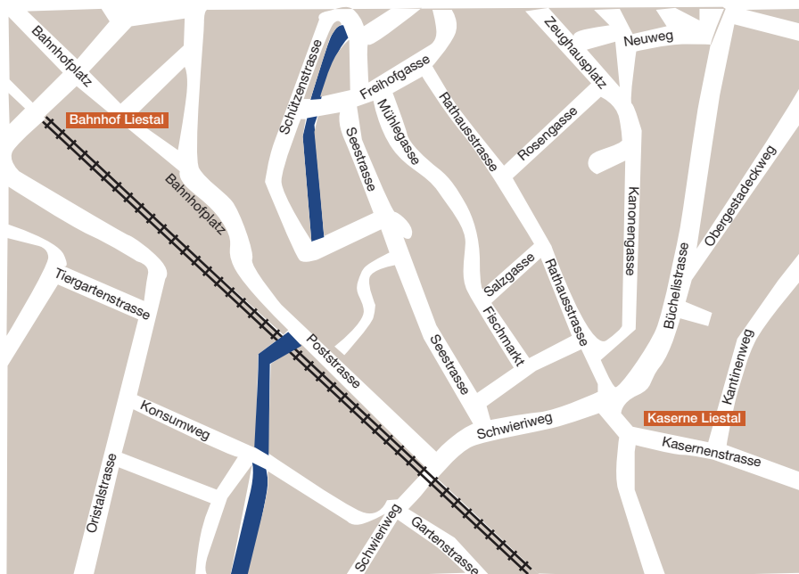
Weg vom Bahnhof Liestal zum Tagungsort: ca.15 Minuten